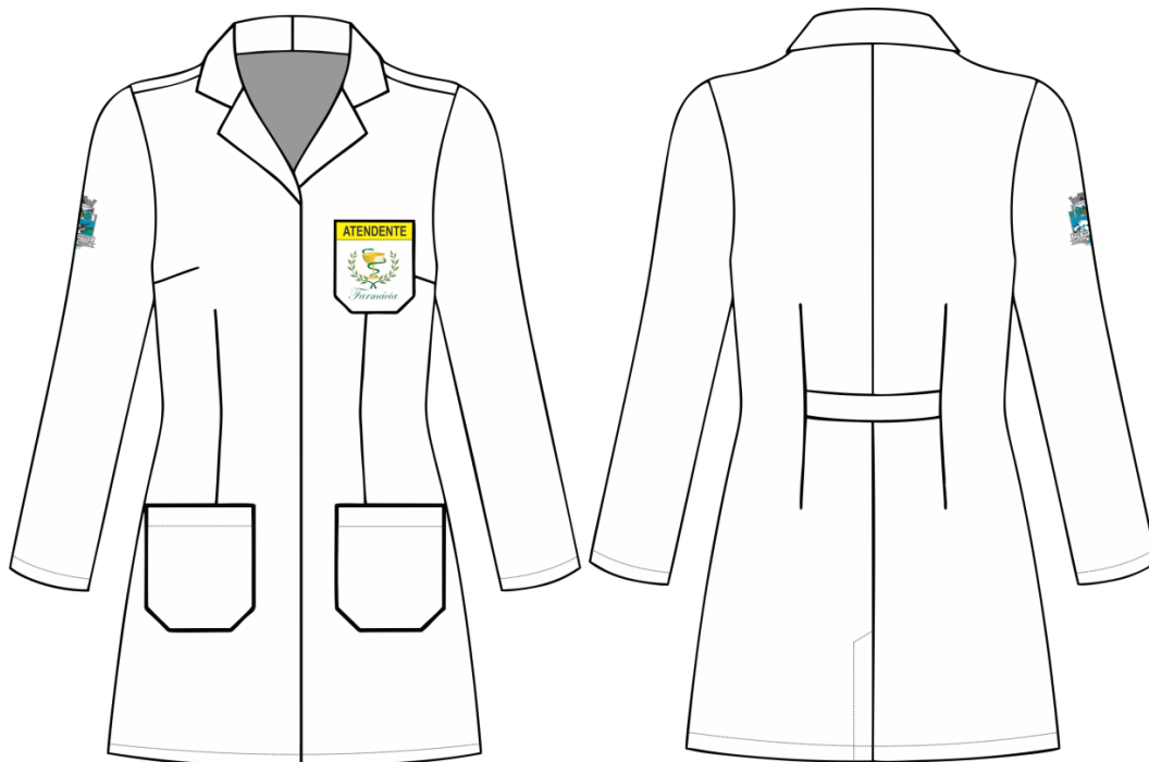
Jaleco - Atendente - FEM