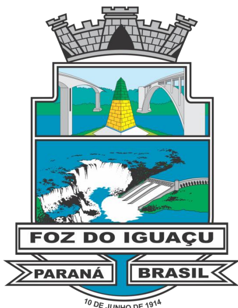
IMAGEM 2: BRASÃO DA PREFEITURA

As empresas licitantes deverão obrigatoriamente apresentar amostra do tecido para avaliação e aprovação da Assistência Farmacêutica Municipal. Podendo estes ser entregues junto à documentação.