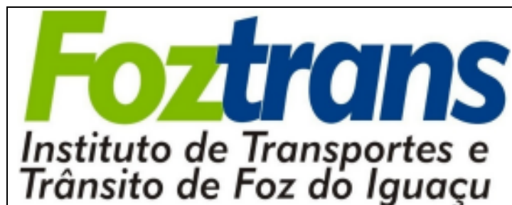
Imagem ampliada do adesivo a ser utilizado.