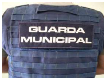
Ilustração da Placa de Identificação

Cada capa deverá possuir uma identificação em tecido tipo CORDURA na mesma cor, medindo 25 cm x 11 cm, com acabamento em bordado nas bordas na cor prata com 3 mm de largura, na parte frontal a inscrita bordada GUARDA MUNICIPAL, na cor prata, fonte micrograma, no tamanho proporcional de forma a ocupar toda a extensão desta placa e na parte traseira velcro macho em toda sua extensão afim de fixar no porta identificador, conforme figura 03).