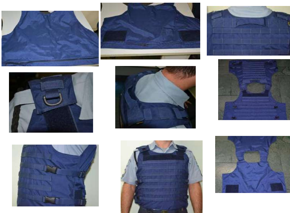
ILUSTRAÇÃO DA CAPA

Possuir fitas (na tonalidade da capa do colete) em poliéster com espessura de 2mm, com 25mm de largura, de 45 cm de comprimento proporcional ao tamanho do colete, a cada 27mm na horizontal com costuras em travete a cada 40mm para fixação de acessórios e porta identificador.