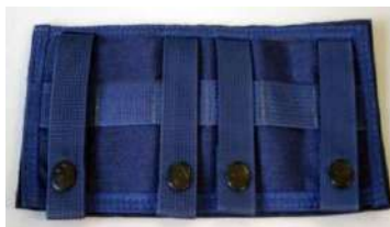
Ilustração do Porta Identificador

Cada capa deverá possuir uma unidade de porta identificador, similar ou de qualidade superior, na mesma cor, em poliéster que garante maior qualidade e durabilidade ao produto contra risco e não soltar fio, medindo 25cm x 11cm, sendo um lado com quatro fitas de poliéster medindo 2,5cm de largura x 10 cm de comprimento com botões de pressão nas extremidades das fitas para fixação na capa de colete modular, e outro lado com velcro fêmea costurado em toda sua extensão, conforme figura 02.