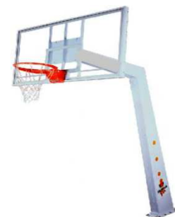
Item 06 e 07