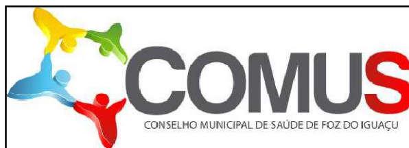
Logo completa – Item 1

6.2. Item 2 - COLETE CR: personalização em bordado; COLETE em cor azul marinho, modelo unissex, sem mangas, confeccionado em brim ou em sarja, resistente ao uso e às lavagens, conservando a cor, fechamento frontal com zíper, com 04 bolsos dianteiros (sendo 2 bolsos superiores com fechamento em velcro e com aba em tecido refletivo na cor prata e 02 bolsos localizados na parte inferior com fechamento em zíper). Nas costas, duas faixas verticais de 5cm de largura em tecido refletivo de cor prata. Na frente e nas costas, logotipos em bordado colorido.