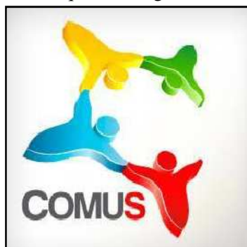
Logo simples – Item 1

01 - Na frente, acima do velcro esquerdo - logo SIMPLES