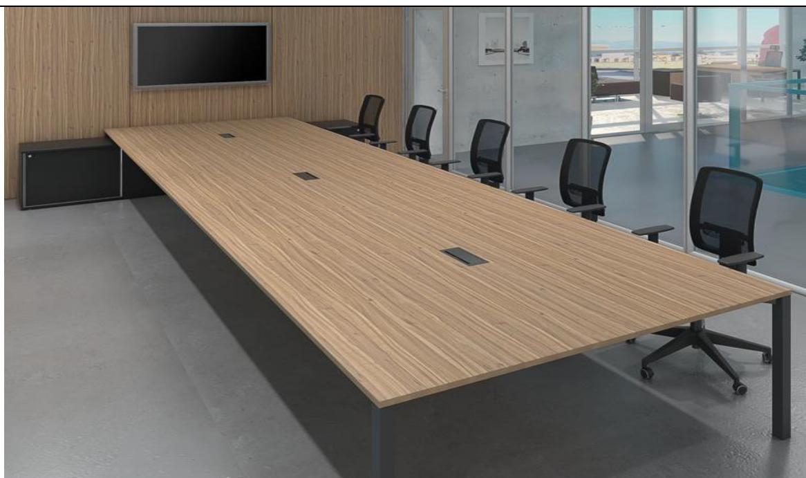
IMAGEM MERAMENTE ILUSTRATIVA PARA A MESA DE REUNIÕES COM PAINEL PARA TV E MÍDIA