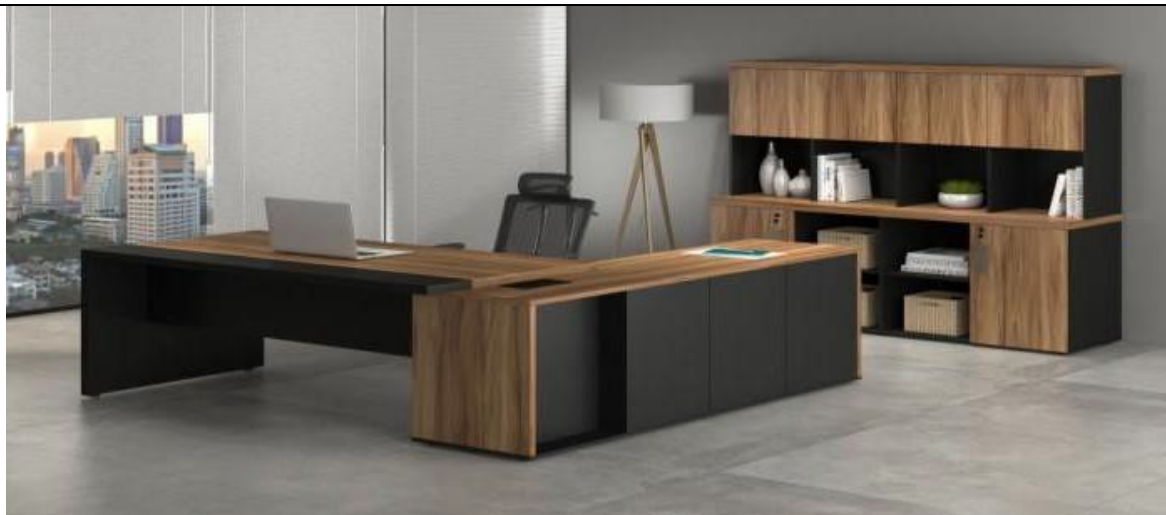
IMAGEM MERAMENTE ILUSTRATIVA PARA AS MESAS SIMPLES EM L