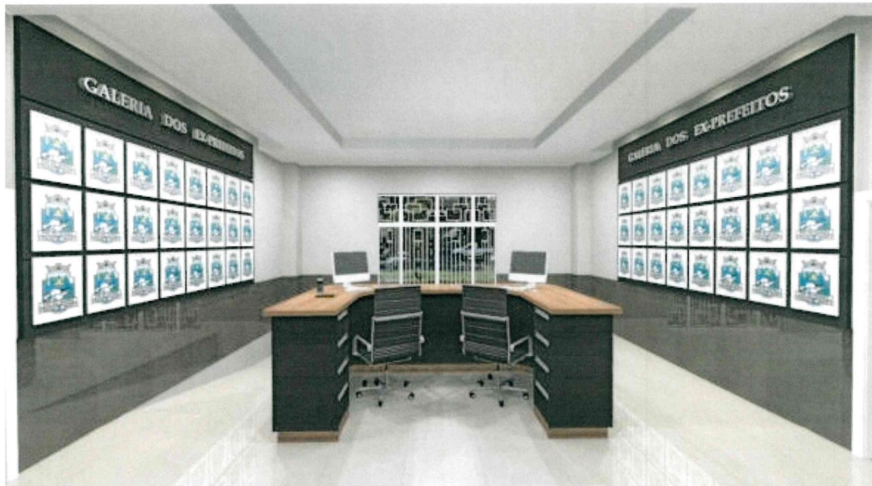
IMAGEM MERAMENTE ILUSTRATIVA PARA A RECEPÇÃO DO PALÁCIO CATARATAS