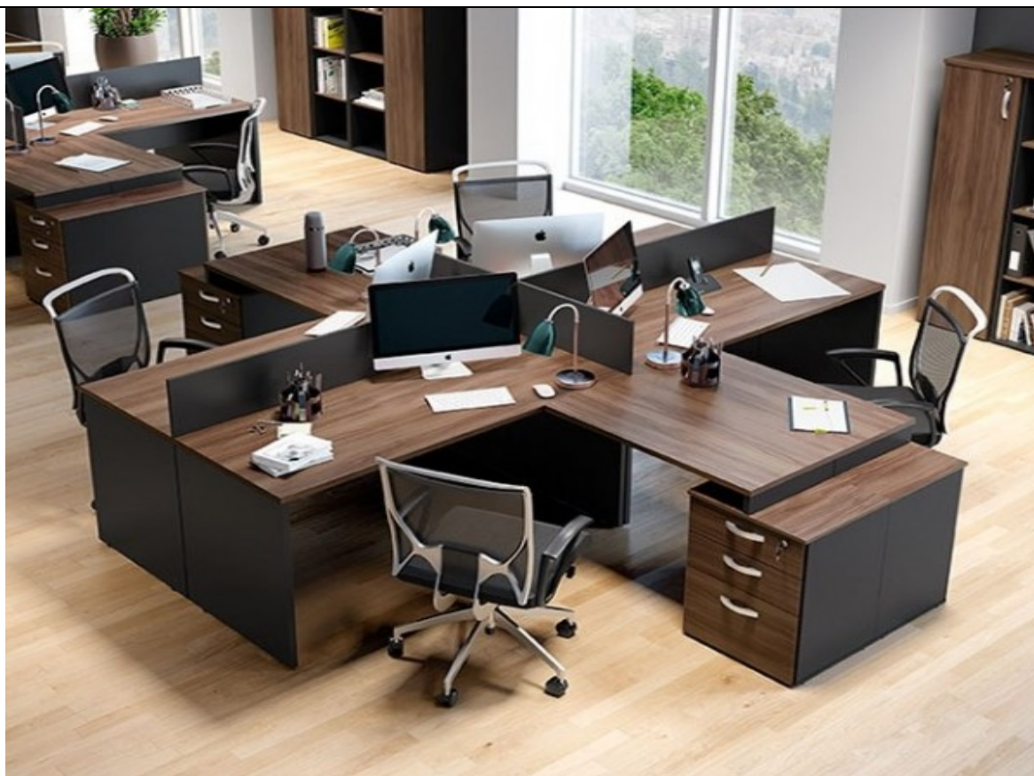
IMAGEM MERAMENTE ILUSTRATIVA PARA AS MESAS EM L COM DIVISÓRIAS